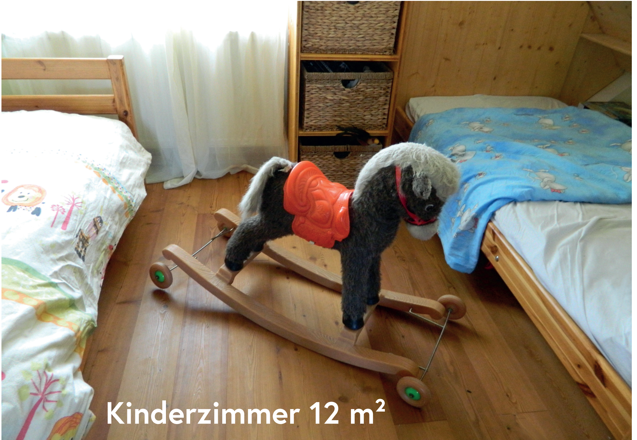
Kinderzimmer 12 m 2